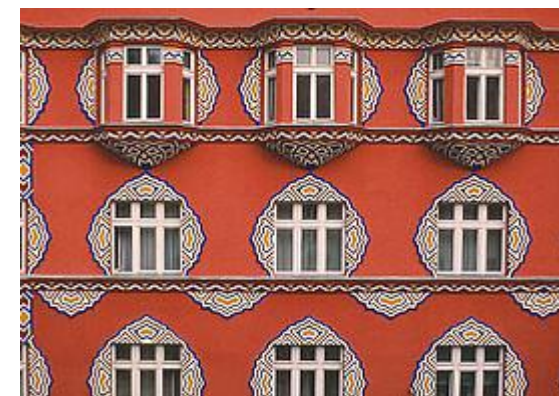
Verslo banko pastatas (Slovėnija)