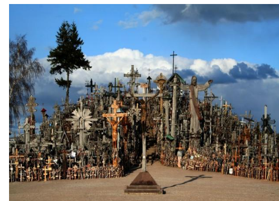
Kryžių kalnas (Lietuva)