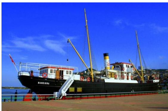
Bandirma laivas (Turkija)