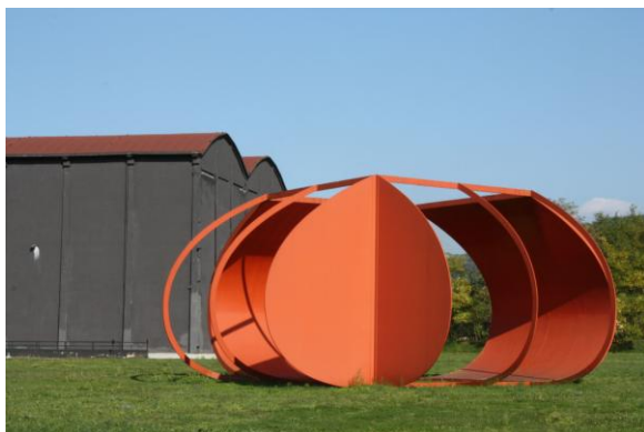
Burri šiuolaikinio meno kolekcija (Italija)