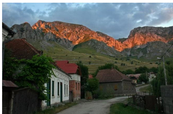
Rimetea kaimas, Szeklers uolos (Rumunija)