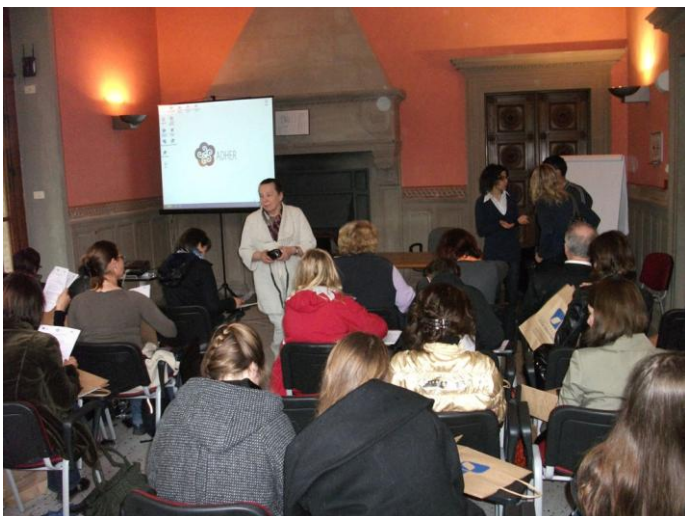
Partnerių susitikimas Italijoje 2010 balandžio mėn.