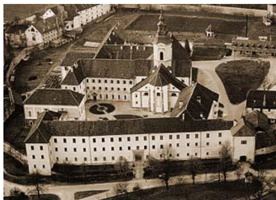
Stična vienuolynas (Slovėnija)