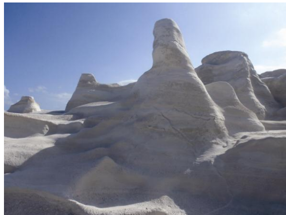
Sarakiniko vaizdas (Graikija)