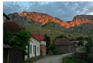
Satul Rimetea, Piatra Secuiului