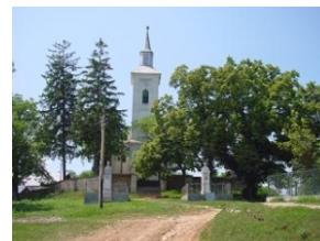
Biserica Protestantă din Macău