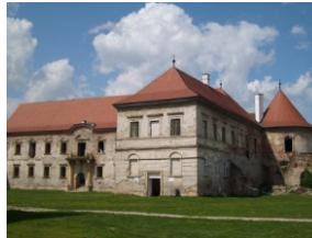
Castelul Banffy, satul Bontida